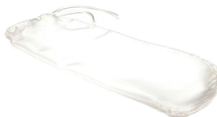
▲ 150 микрон мешок для образцов