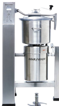
▲ Blixer™ 23