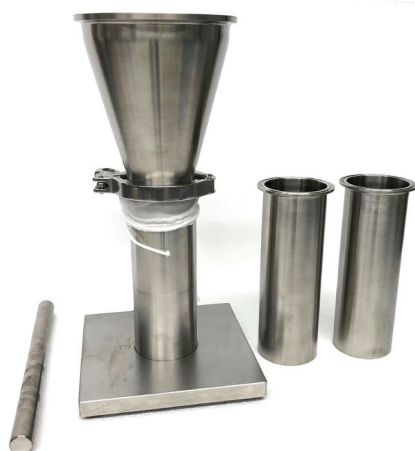
▲ Загрузчик образца