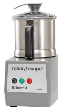
▲ Blixer™ 3